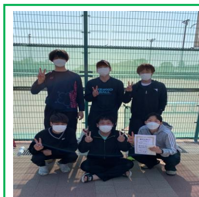
〈伊香 S T A〉