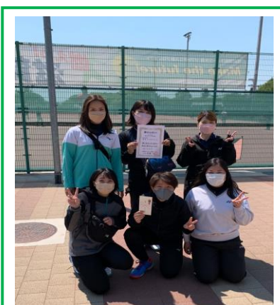
〈大津 S T A（A）〉